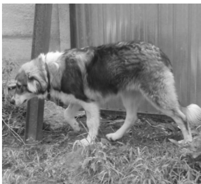
CIOBANESC ROMANESC CARPATIN