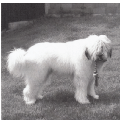
CIOBANESC ROMANESC MIORITIC