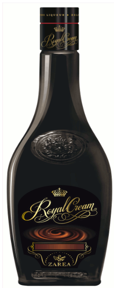
Royal Cream ZAREA