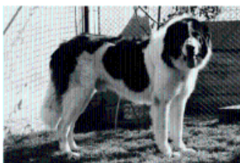
CIOBANESC ROMANESC DE BUCOVINA