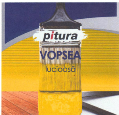
pitura VOPSEA lucioasă

(531) Clasificare Viena: 29.01.15; 27.05.01; 27.05.17; 07.15.05; 20.01.05; 26.11.05; 26.11.08; 25.07.20 (591) Culori revendicate: negru, roșu, alb, galben, mov, gri, maro (511) Produse și/sau servicii grupate pe clase: