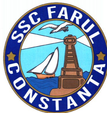
SSC FARUL CONSTANTA

(531) Clasificare Viena: 27.05.01; 27.05.24; 06.03.10; 03.07.09; 18.03.02; 18.03.23; 29.01.15; 01.01.01; 01.01.03; 07.01.16; 07.03.15; 26.01.13; 26.01.22