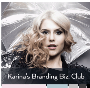
Karin's Branding Biz. Club

(591) Culori revendicate:roz, albastru, gri deschis, gri închis, negru