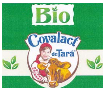
Bio Covalact de Tara

(591) Culori revendicate:verde închis, verde deschis, roșu, maro închis, maro deschis