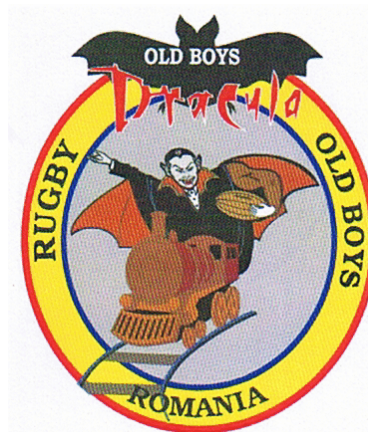
RUGBY Dracula OLD BOYS ROMANIA