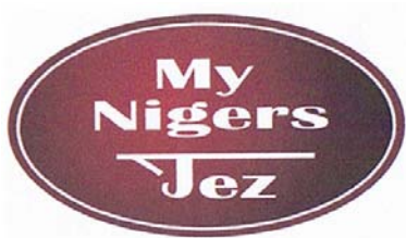
My Nigers Tez