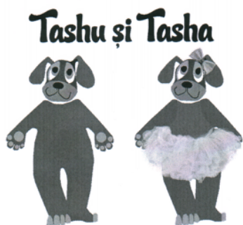
Tashu și Tasha

25 Articole de îmbr c minte i înc l minte, articole pentru acoperirea capului. (Solicit m protec ie pentru întreaga list de produse incluse în această clas conform clasific rii de la Nisa).