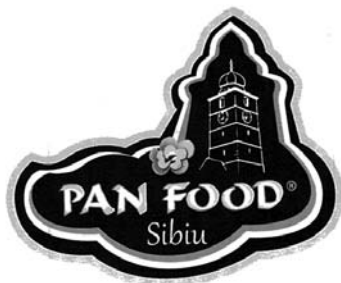
PAN FOOD Sibiu

(531) Clasificare Viena :050521; 070103; 070106; 250119; 270501; 270502;