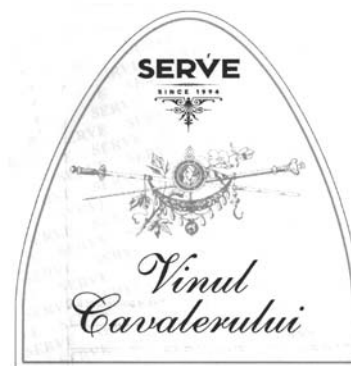
SERVE SINCE 1994 VINUL CAVALERULUI

(531) Clasificare Viena :020301; 050521; 170213; 230101; 250119; 270501;