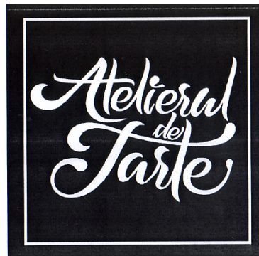
Atelierul de Tarte

(531) Clasificare Viena: 260418; 270501; 270502; 270507; 270511;