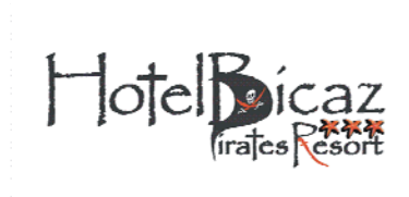
Hotel Biczaz Pirates Resort