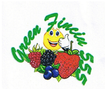
Green Finciu 555

(591) Culori revendicate:roșu, albastru, verde, galben, mov