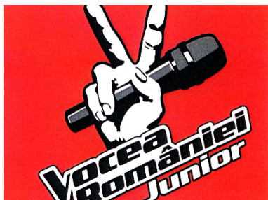
Vocea României Junior

(591) Culori revendicate:roșu, alb, negru