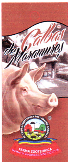
Călbăș de Maramureș