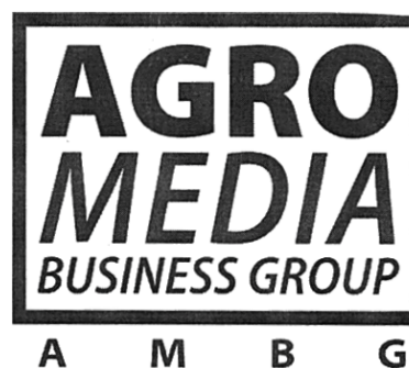
AMBG AGRO MEDIA BUSINESS GROUP

(531) Clasificare Viena: 260418; 260422;