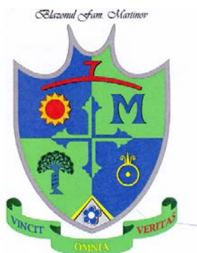
Blazonul fam. Martinov M VINCIT OMNIA VERITAS

(591) Culori revendicate: verde, albastru, roșu, galben, negru, gri