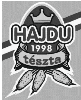
HAJDU tészta 1998