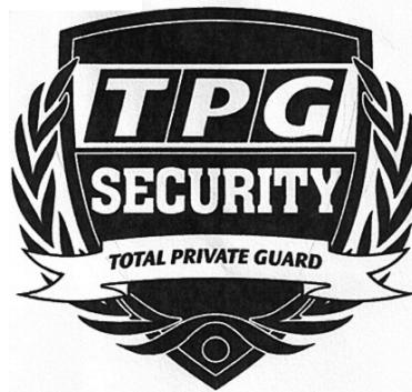
TPG SECURITY TOTAL PRIVATE GUARD

(531) Clasificare Viena :050320; 090110; 240105; 240117;