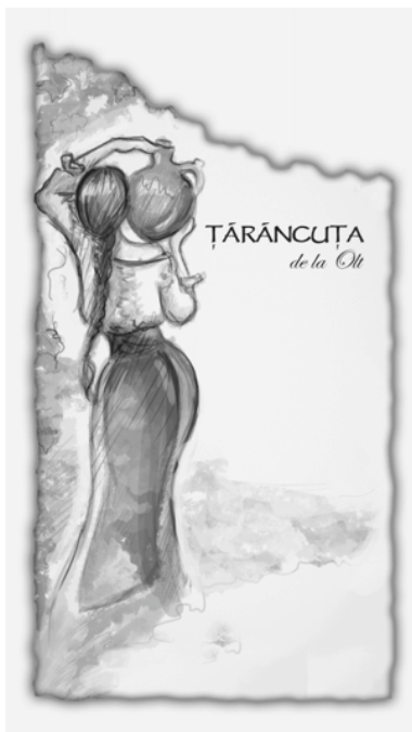
ȚĂRÂNCUȚA de la Olt

(531) Clasificare Viena: 020304; 190901; 190902; 250119; 270501;