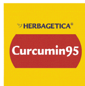
HERBAGETICA Curcumin 95