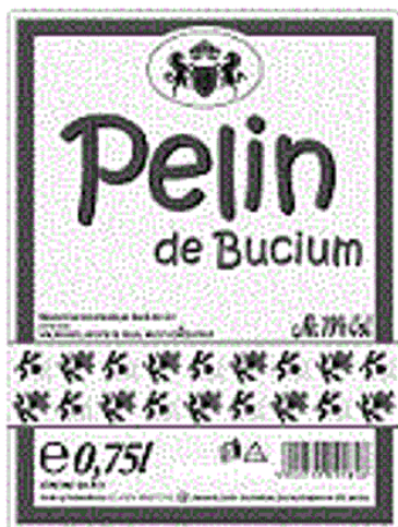
Pelin de Bucium

(531) Clasificare Viena: 250119; 260418;