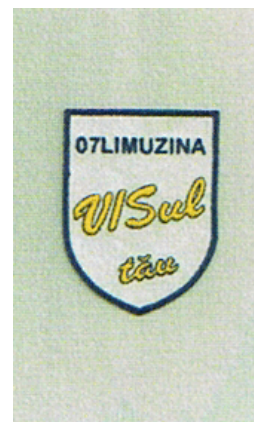
07 LIMUZINA VISUL TAU

(591) Culori revendicate:albastru închis, galben, alb, negru (531) Clasificare Viena: 240115; 270502; 270711; 290114;