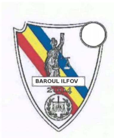
BAROUL ILFOV 2004

(591) Culori revendicate:roșu, galben, albastru, negru