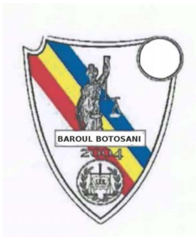
BAROUL BOTOSANI 2004

(591) Culori revendicate:roșu, galben, albastru, negru