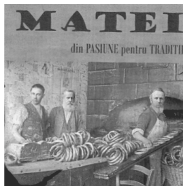
MATEI din PASIUNE pentru TRADITIE

(531) Clasificare Viena: 020111; 020124; 070309; 080125; 270502; 270503; 270508; 270509; 270517;