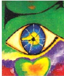
Avantgard Art arts & crafts virtual gallery