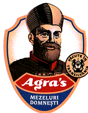
Agra's MEZELURI DOMNEȘTI

(591) Culori revendicate:negru, albastru, roșu, alb, galben, auriu