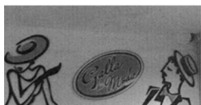
Galla di Moda

(531) Clasificare Viena :020702; 260118;