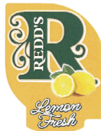
REDD'S LEMON FRESH

(591) Culori revendicate:galben, portocaliu, verde