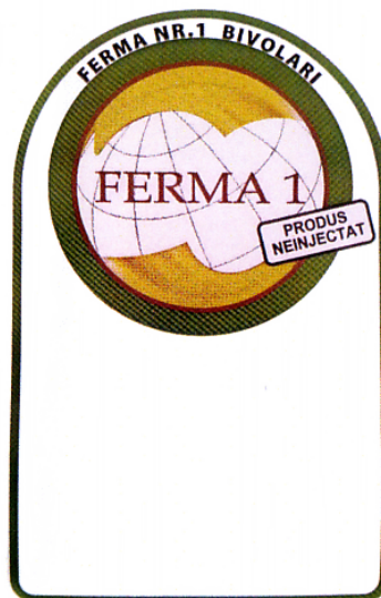
FERMA 1 FERMA NR. 1 BIVOLARI PRODUS NEINJECTAT

(591) Culori revendicate:maron, galben, verde, negru