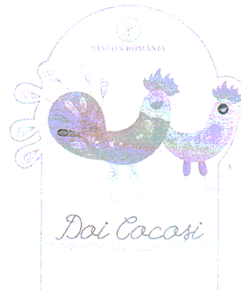
DOI COCOSI - VINCON

(531) Clasificare Viena: 030703; 270508; (511) Produse și/sau servicii grupate pe clase: