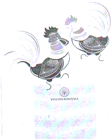
DOI COCOSI - VINCON ROMANIA