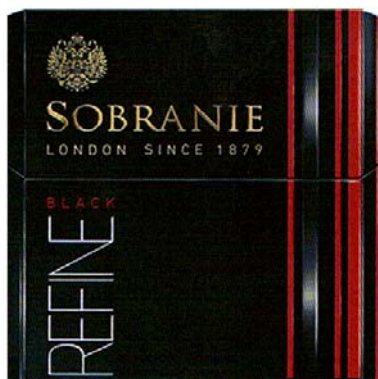
SOBRANIE REFINE BLACK