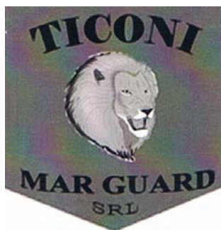
TICONI MAR GUARD

(591) Culori revendicate: negru, alb, gri