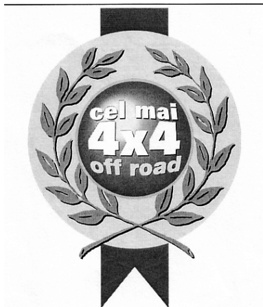
Cel mai 4x4 off road