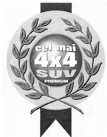
cel mai 4x4 SUV PREMIUM

(531) Clasificare Viena: 240115; 260118;