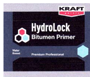
KRAFT PAINTS HydroLock Bitumen Primer

(531) Clasificare Viena:250119; 260403; 270508;