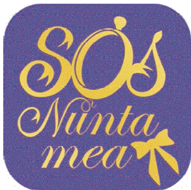
S.O.S Nunta Mea