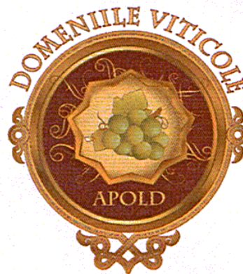
DOMENIILE VITICOLE APOLD