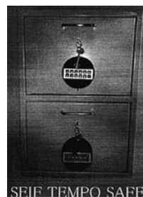
SEIF TEMPO SAFE

(531) Clasificare Viena: 120125; 140506; 140521; 190104; 270524;