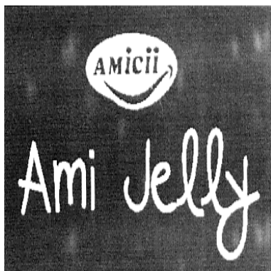
AMICII Ami Jelly