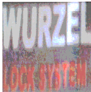
WURZEL LOCK SYSTEM