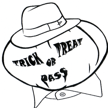
TRICK OR TREAT PASS

(531) Clasificare Viena:090310; 090313; 090717; 270508;