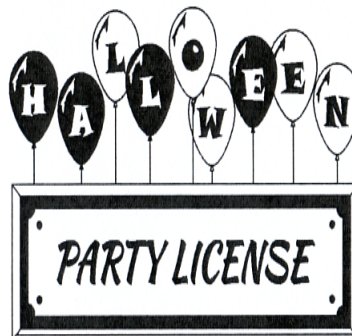
HALLOWEEN PARTY LICENSE

(531) Clasificare Viena:260418; 270504; 270506; 270515;