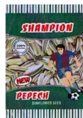
SHAMPION PEPECH SUNFLOWER SEED