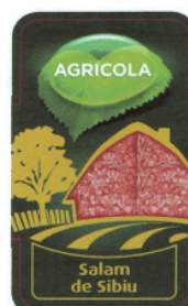
AGRICOLA Salam de Sibiu

(591) Culori revendicate:verde, galben, roșu