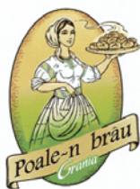
Poale-n brâu Grania