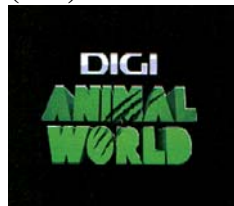
DIGI ANIMAL WORLD

(591) Culori revendicate:verde închis, verde deschis, albastru închis, negru