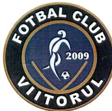
FOTBAL CLUB VIITORUL 2009

(591) Culori revendicate:negru, albastru, alb