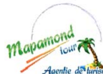
mapamond tour Agentie de turism

(591) Culori revendicate:verde, albastru, galben, portocaliu, maro