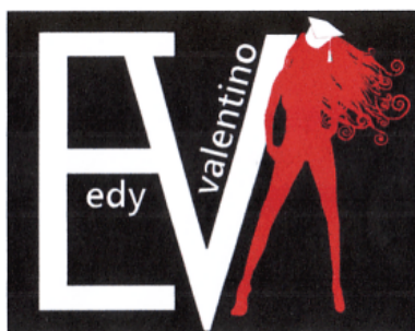
EV edy valentino