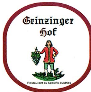
Grinzinger Hot Restaurant cu specific austriac

(591) Culori revendicate:roșu, vișiniu, verde, galben, bleu