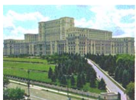
Arhitect Anca Petrescu

(591) Culori revendicate:albastru, verde, alb, gri, bej, negru