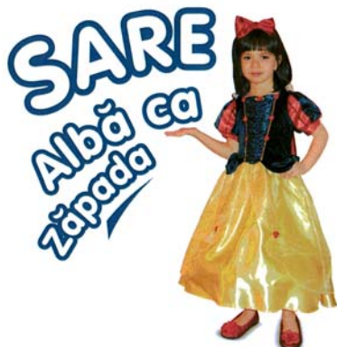
SARE Albă ca zăpada

(591) Culori revendicate:galben, albastru, negru, roșu (531) Clasificare Viena :020503; 020504; 270511; 290113; (511) Produse și/sau servicii grupate pe clase: