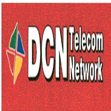
DCN Telecom Network

(591) Culori revendicate:roșu, alb, verde, albastru, galben, negru