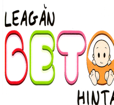
LEAGĂN BETO HINTA

(591) Culori revendicate:ciclamen27.5.2 (pantone 232C, 706C), verde (pantone 382C, 7496C), violet (pantone 670C), portocaliu (pantone 7411C, 7506C, 464C, 476C), roz (pantone 691C)