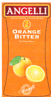
ANGELLI ORANGE BITTER

(591) Culori revendicate:portocaliu, verde, vișiniu, auriu, alb