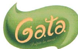
Gata Pofțiți la masă!